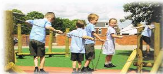
Pont de Birmanie