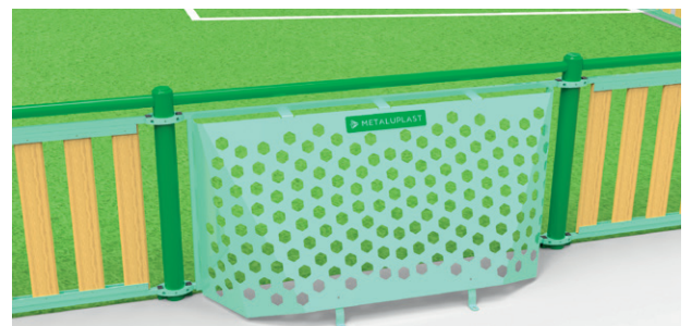
► One-piece brazilian football goal / But de foot brésilien monobloc