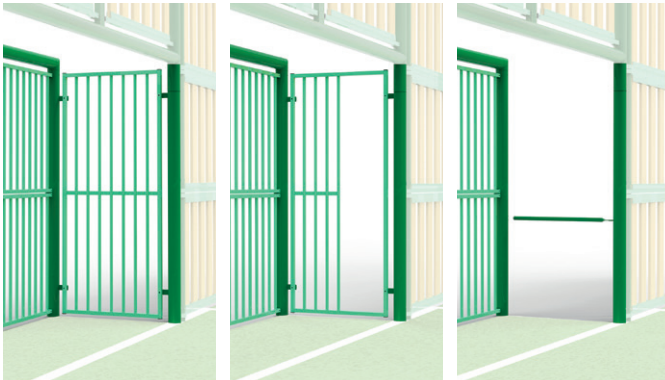
► Closed goal, half-open, or anti-cycle passage / But fermé, semi-ouvert, ou barrière anti-cycle

► REPLISSAGE PANNEAUX EN BOIS OU PVC RECYCLÉ