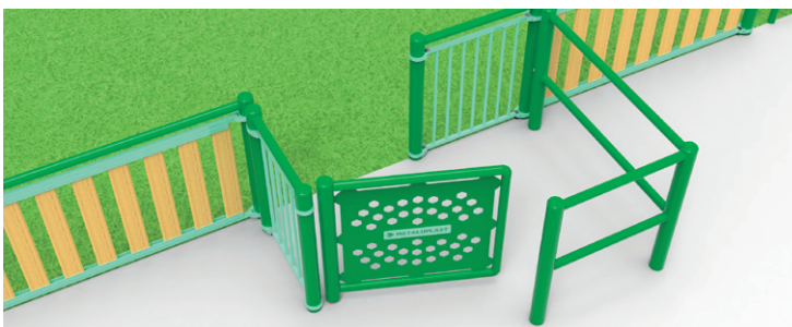
► Independent PRM access / Accès PMR indépendant