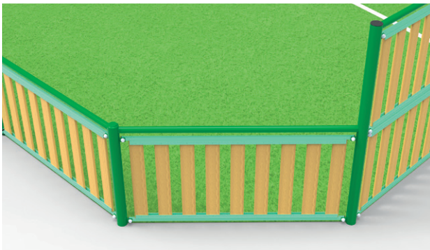
► Cut-off corners / Pans coupés