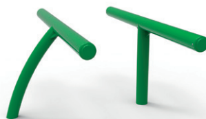
► Standing bench / Banc assis-debout