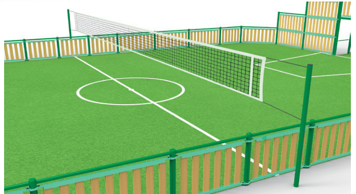
► Multi-sports posts: volley, tennis, badminton / Poteaux multisports : volley, tennis, badminton