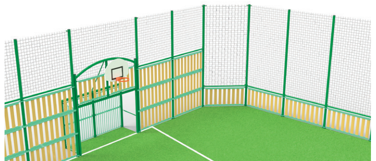
► Ball-stop enhancement on sides and pediments / Réhausses pare-balls sur frontons et palissades